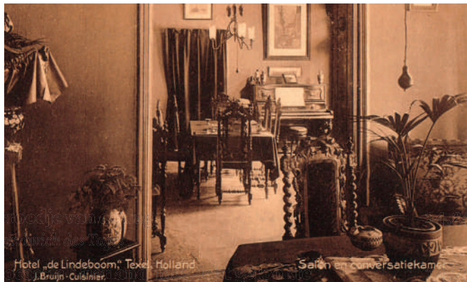
Hotel „de Lindeboom“, Texel, Holland J. Bruijn - Cuijlmier

Rondje 'Lindeboom' mit Tagessuppe und drei Texeler Brötchen mit Thunfischsalat, Carpaccio und Texeler Bauernkäse