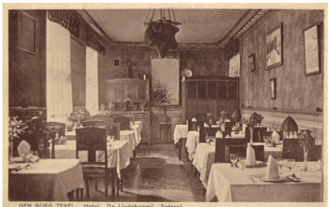
DEN BURG TEXEL. Hotel „De Lindeboom“. Eetzaal