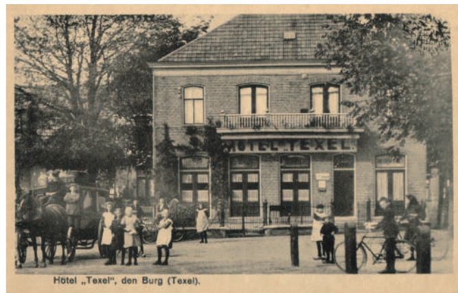
Hôtel „Texel“, den Burg (Texel).

Huisgemaakte falafel met saffraanrijst, groenten en knoflooksaus 25,50 Hausgemachte Falafel mit Safranreis, Gemüse und Knoblauchsauce